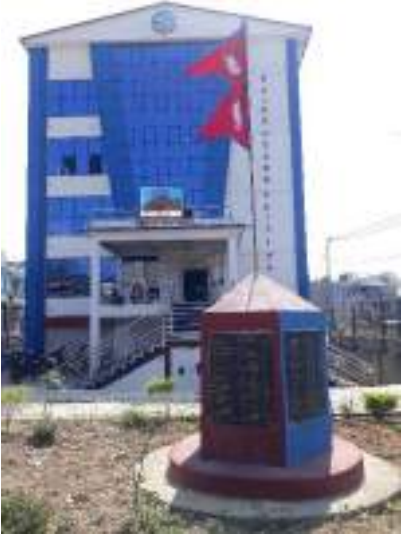
पालुङटार नगरपालिका नगरकार्यपालिकाको कार्यालयको प्रशासनिक भवन